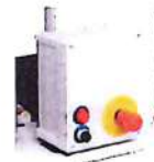
KIT CUADRO CONTROL CON TEMPORIZADOR