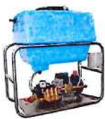
Chasis Acero inox